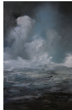
Boði, 2012, olía á striga, 74x50 cm