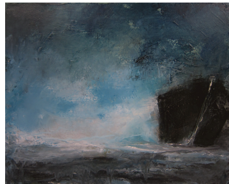
Bátur, 2011, olía á striga, 40x50 cm