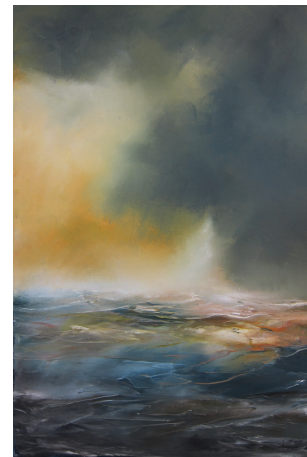
Bjarmi, 2012, olía á striga, 74x50 cm