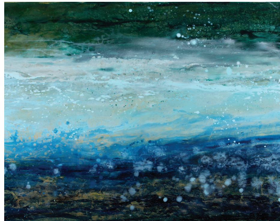
Straumar 6, 2011, olía á striga, 100x140 cm